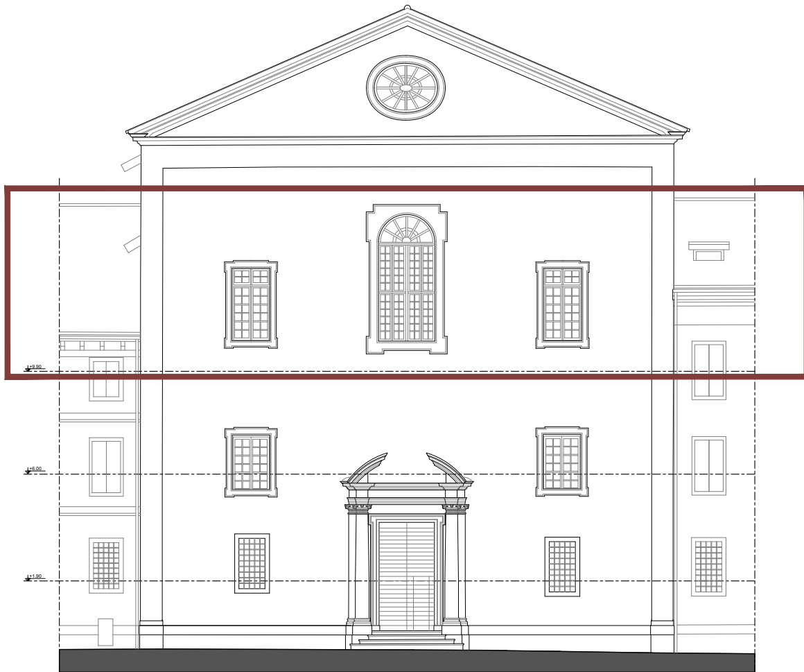
AREA OGGETTO DI INTERVENTO

nota: le quote dimensionali e altimetriche sono espresse in metri